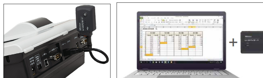
* Série SJ-410 avec Technologie U-Wave

Afficher les informations sur le produit